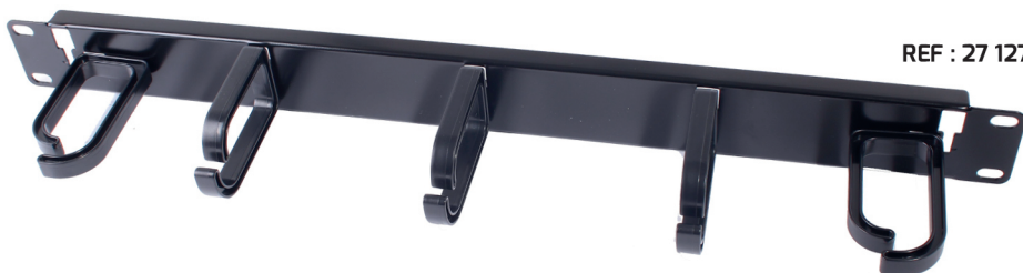
REF : 27 127