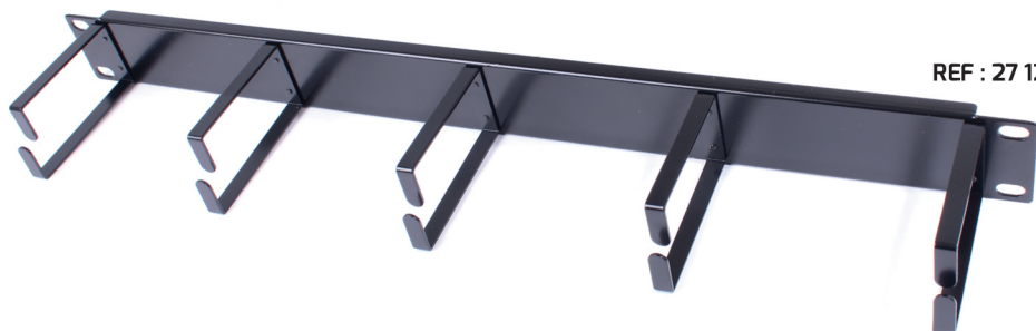
REF : 27 129