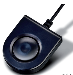
Télécommande de sélection de port