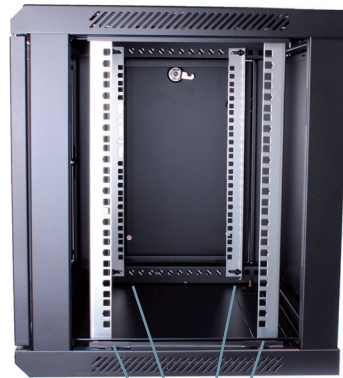
4 montants 19" 2 avants - 2 arrières