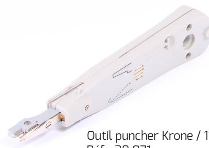
Outil puncher Krone / 110 Réf : 28 071