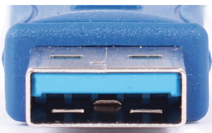
Connecteur type A mâle