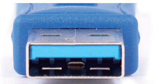
Connecteur type A mâle